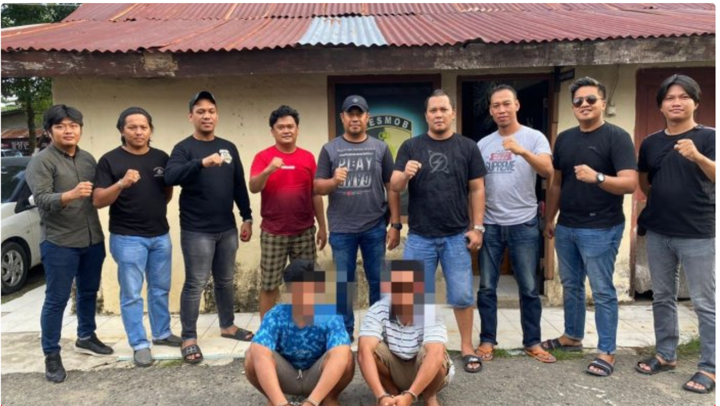
Tim Resmob Reskrim Polres Morowali saat menangkap pelaku pembunuhan

MOROWALI, Sulawesi Tengah- Pelaku penikaman perut terburai keluar hingga menyebabkan korbannya meninggal dunia inisial E (29) yang baru-baru ini terjadi di wilayah Kecamatan Bahodopi telah berhasil di tangkap Satreskrim Polres Morowali.